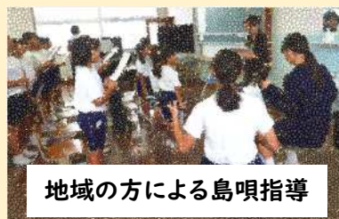
地域の方による島唄指導

11月13日(木)の午前中に、町音楽発表会があります。今年度から全学年で参加します。島唄の斉唱と合奏をします。是非、応援にいらしてください。